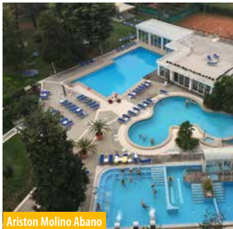
Ariston Molino Abano

Frühbuchungsrabatt bis 3. März 2024 Fr. 40.00 pro Person