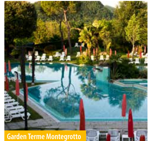
Garden Terme Montegrotto

Wenn Sie das Gefühl haben, dass der Alltag zu viel wird und Sie einengt, ist der Moment gekommen, abzuschalten und sich einen Ort zu suchen, wo Sie sich wiederfinden und die schlummernden Energien wieder wecken können.